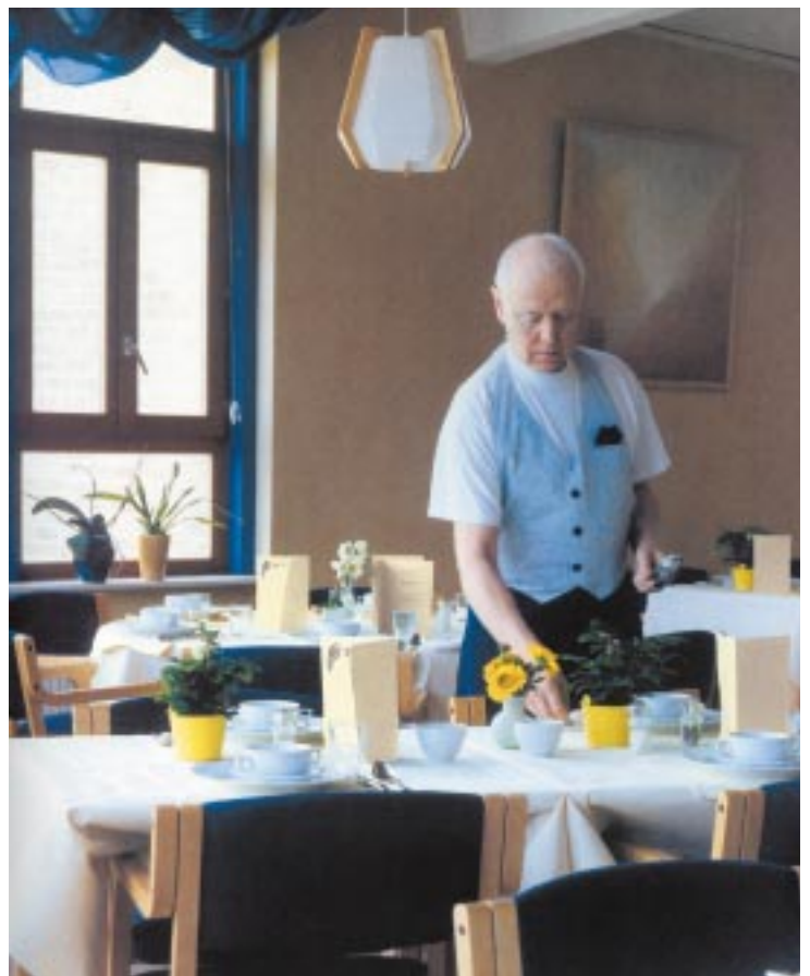
Elke dag eten in een restaurant